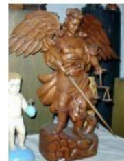
Tallado en Madera